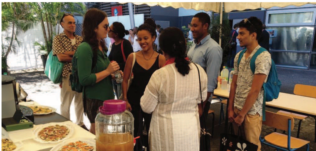
Échanges entre professeurs et étudiants à l'issue de l'ouverture du séminaire IONAS à l'école d'architecture du Port.