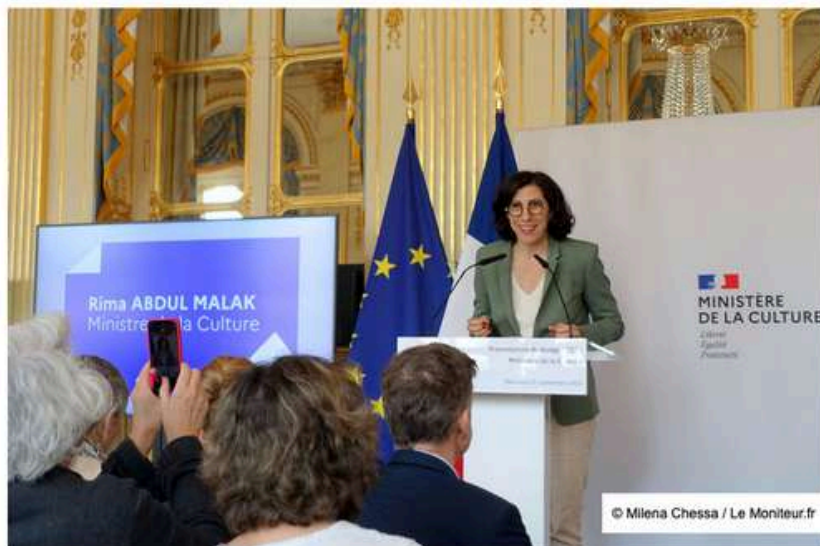
La ministre de la Culture, Rima Abdul Malak, lors de la présentation du budget 2024, rue de Valois à Paris (1er).