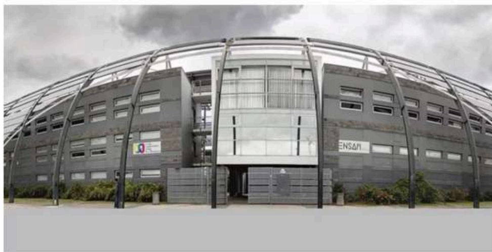
L'ENSA de La Réunion s'émancipe

A l'occasion de la présentation du budget de son ministère pour l'année 2024, la ministre de la Culture Rima Abdul Malak a annoncé ce mercredi 27 septembre 2023, la création de l'École nationale supérieure d'architecture (ENSA) de La Réunion. Et ce en collaboration avec la ministre de l'Enseignement supérieur et de la Recherche Sylvie Retailleau et le ministre délégué chargé des Outre-mer Philippe Vigier, l