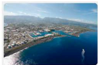
Fig. 2 : Une île en croissance.

l'île Maurice se trouve à 200 km à l'ouest et Madagascar à 800 km à l'est. Par 21° de latitude sud, La Réunion est une île tropicale qui lui confère également la position dans un contexte particulier, quant à l'environnement immédiat dans lequel l'architecture et l'aménagement doivent s'inscrire. Ces distances pointent l'éloignement de ce département ultramarin du sol métropolitain et mettent en avant son immersion dans un bassin indianocéanique, ayant ses propres références, notamment au milieu tropical.