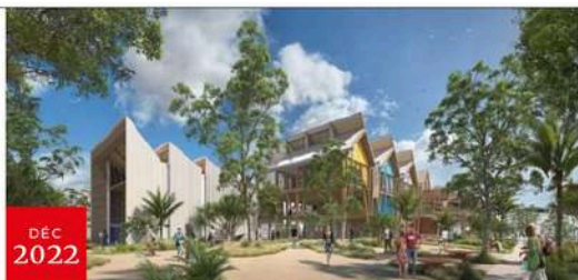
Illustration de la future école d'architecture du Port qui devait être une vitrine d'architecture contemporaine responsable et rayonner au-delà de La Réunion. © OBA