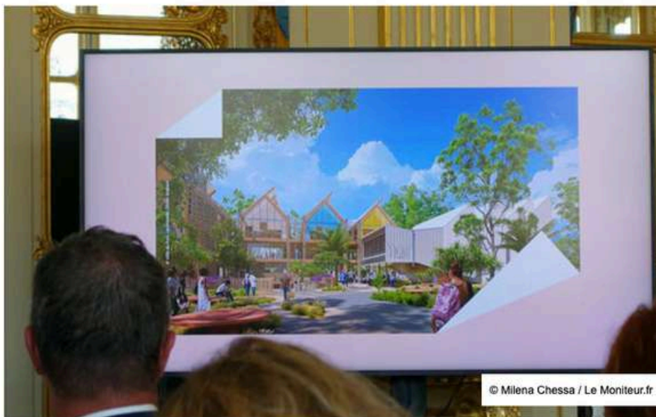
Image de synthèse du projet de l'école nationale supérieure d'architecture de La Réunion, dans la commune du Port, par l'architecte Olivier Brabant.