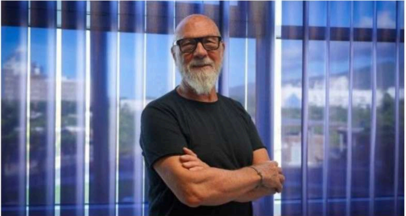
Le directeur de l'Ensam La Réunion répond aux questions d'Eska-Press.