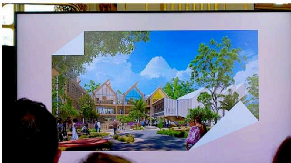
Image de synthèse de la future ENSA Réunion