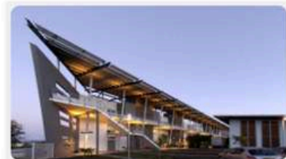
Fig. 3 : Le bâtiment de l'école conçu par Architecture-Studio. Photo extérieure de l'école en attente

Les deux écoles, art et architecture, cohabitent dans un même lieu, encore actuellement, donnant lieu par moments à des pédagogies partagées pour certains cours ou workshops.