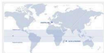
Fig. 1 : Une île française au cœur de l'océan Indien.

Il est important de cerner le contexte réunionnais afin de comprendre la spécificité de cette exception culturelle qu'est l'antenne de l'École Nationale Supérieure d'Architecture de Montpellier (Ensam) à La Réunion, ainsi que les conditions de sa création et de son développement tout au long des années. (fig. 1)