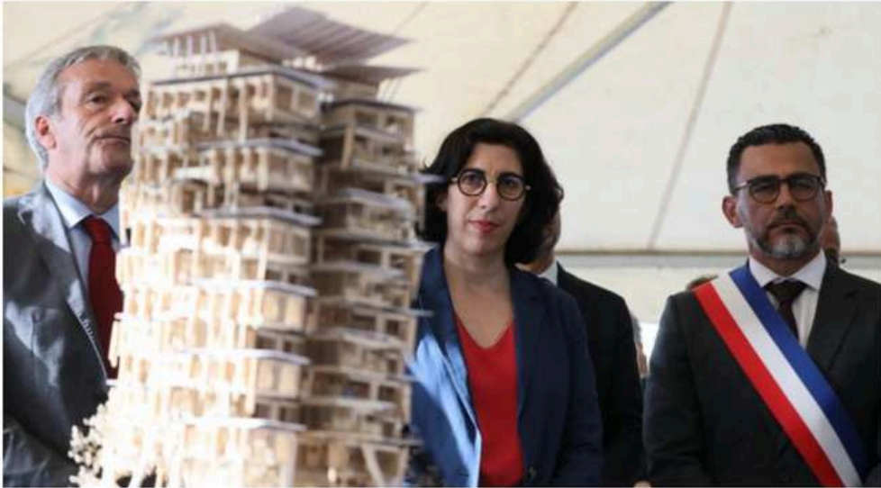
De gauche à droite : ministre chargé des Outre-mer, ministre de la Culture et le maire du Port

La ministre de la Culture et le ministre chargé des Outre-mer se sont rendus en fin de journée au Port pour la présentation de l'école nationale supérieure d'architecture de La Réunion. C'est la 21ème école nationale supérieure d'architecture (ENSA).